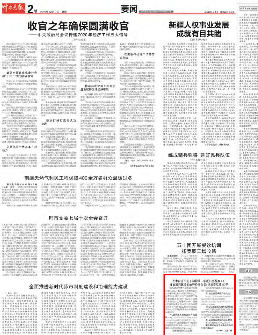
2019年12月9日叶尔羌报公开照片