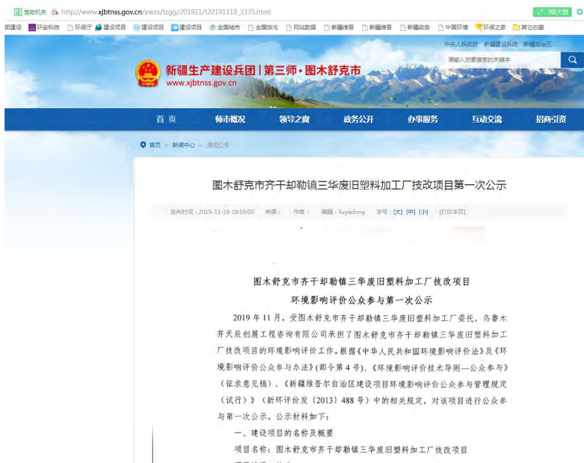
图 2-1 首次环境影响评价信息网上公示截图