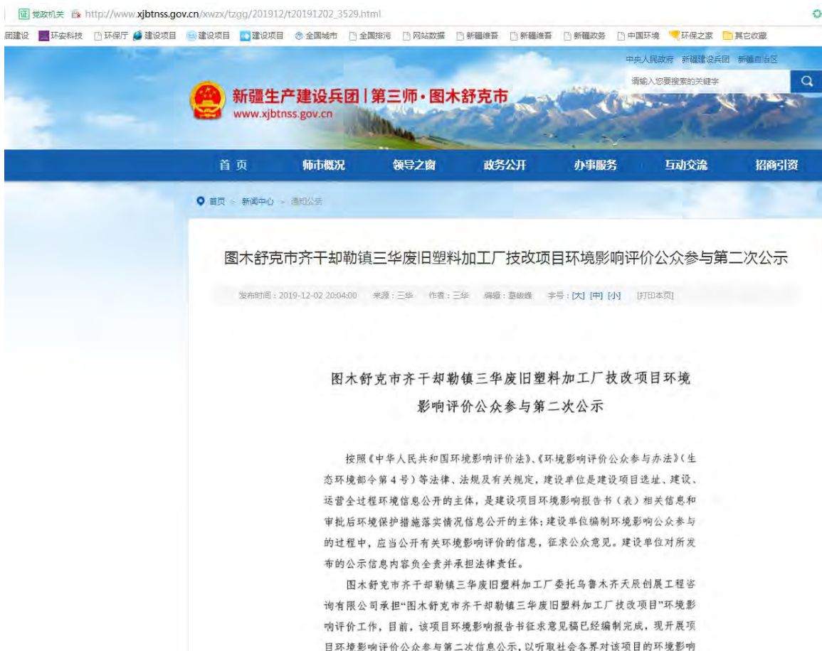
图 3-1 征求意见稿信息网络公开截图